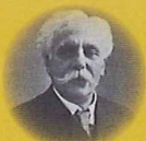
Gabriel Fauré 1845-1924

主催 日本フォーレ協会 http://www.fauré.jp/ (専用フォームでチケットのお申込ができます)