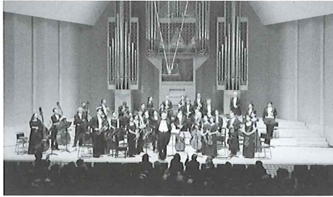
昨年10月21日上野学園 石橋メモリアルホール